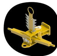
Attelage sur bras de relevage du tracteur cat.3