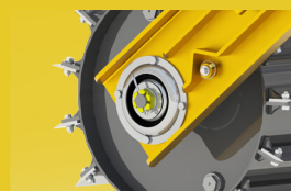
Palier suspendu sur amortisseur caoutchouc